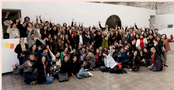
UENIGHETSFELLESSKAP: 240 personer fra 28 organisasjoner deltok på avslutningsseminaret 9. september 2025.