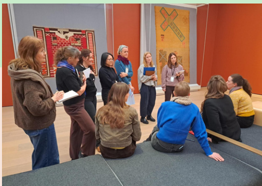
DIALOG I MUSEET: Nansen Fredssenter fasiliterte flere dialoger for Nasjonalmuseet i 2025.

I 2025 fasiliterte Nansen Fredssenter scenedialoger under arrangementer som Pride i Drammen og 1. maifeiring ved Arbeidersamfunnet på Gjøvik, samt folkedialoger under World Expression Forum på Lillehammer og Byfesten i Bærum.