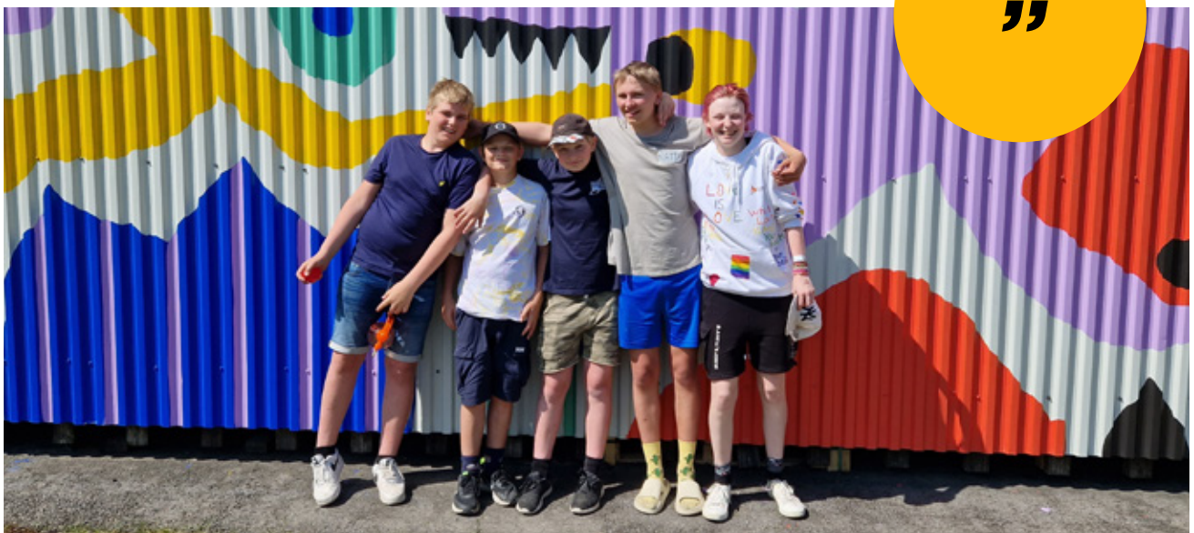
Et knippe av ungdommene som har deltatt i prosjektet foran monsterveggen i Våler.