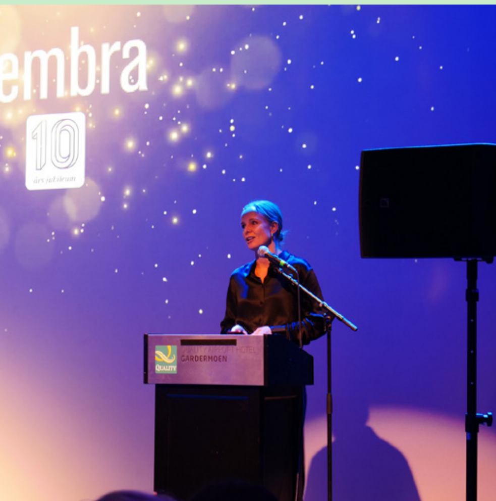
Dembra feiret 10 år med en stor jubileumskonferanse på Gardermoen i november.

men ikke minst gjennom sosiale erfaringer, opplevelse av likeverdig samarbeid og meningsbrytning. Derfor er utviklingen av en demokratisk og inkluderende skolekultur viktig.