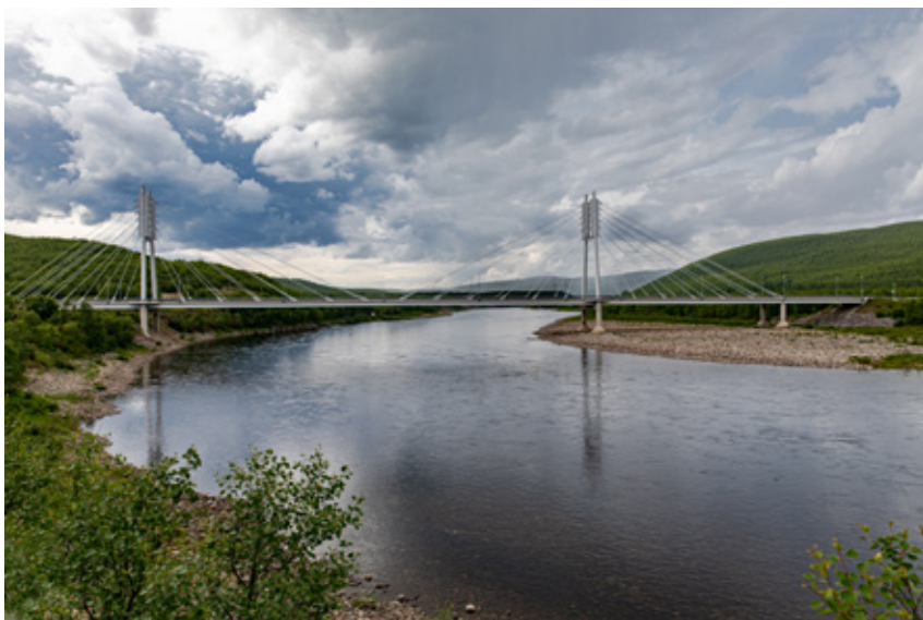
BROBYGGING: Nansen Fredssenter bistår Nasjonalt villakssenter med dialogkompetanse i Tana. Hensikten er å styrke tilliten mellom ulike interesser tilknyttet forvaltning av villaks.

Konflikten er kompleks og involverer mange aktører: Det er splittelse mellom de som vil fiske med garn i sjøen og sportsfiskere, mellom forskere og lokalkunnskap, forvaltere og kommunestyre. Uenighet har det også vært mellom aktører på begge sider av den norsk-finske grensen. En av de mest sentrale konfliktlinjene går mellom samiske interesseorganisasjoner og statlige forvaltningsmyndigheter.