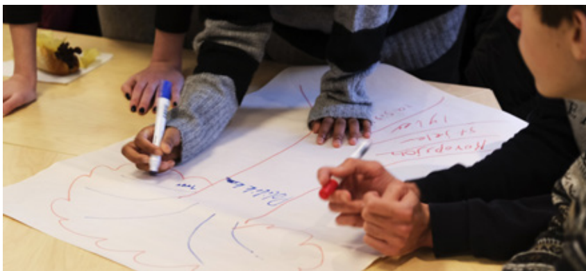
«Fordomstreet», en av senterets mange øvelser som bidrar til å sette ord på egne fordommer.