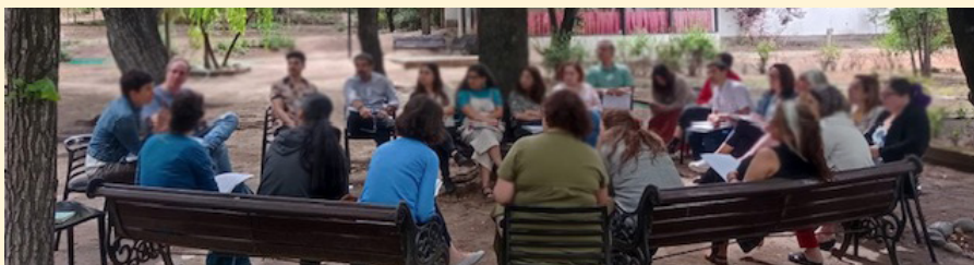
I Araucanía, sør i Chile, bidrar Nansen Fredssenter med kapasitetsbygging i samarbeid med syv universiteter.