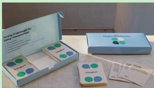
Pakken med dialogkort inneholder seks sett.

Dialogkortene har vært populære, med stadig flere skoler som tar dem i bruk.