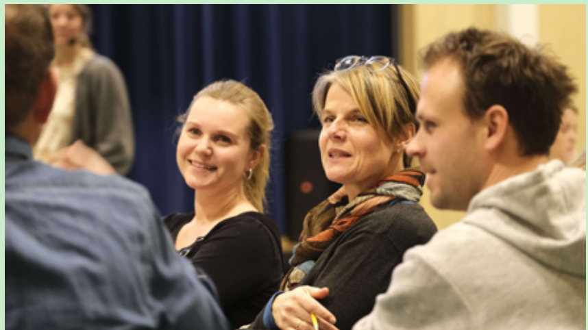
Rollsløkken skole på Hamar er blant skolene som i år deltar i Dembra-satsingen. Her fra samling med hele personalet i november 2023.

– Demokratisk beredskap bygges gjennom kunnskap og refleksjon,