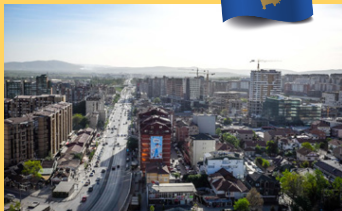
Priština, hovedstaden i Kosovo.