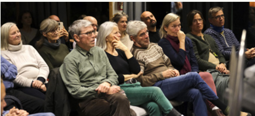
Bie Lorentzen-salen på Nansenskolen var fylt til randen denne kvelden.