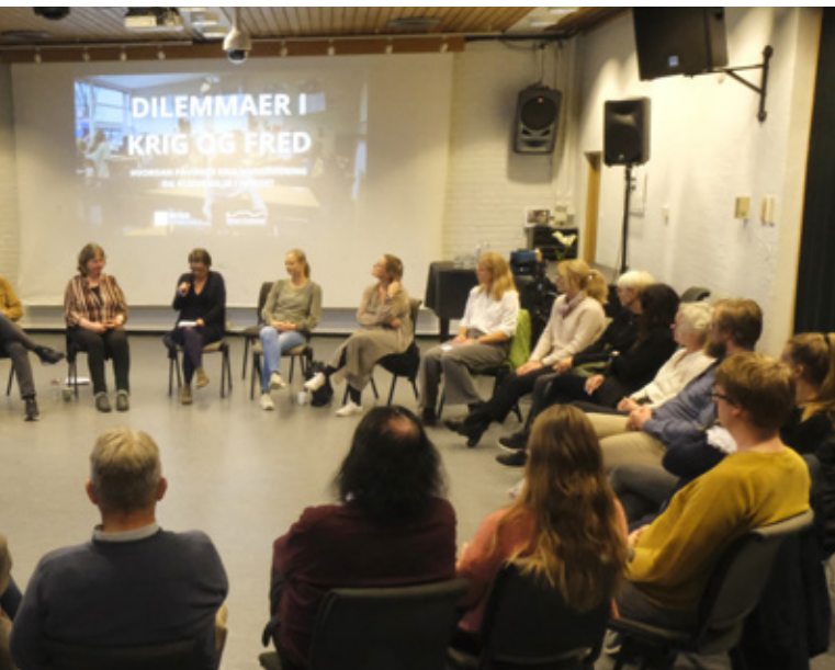
Jubileumskonferansen på Lillehammer ble avrundet med folkedialog.