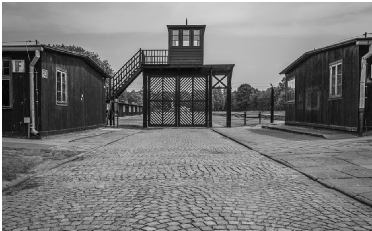
Porten til konsentrasjonsleiren Stutthof utenfor Gdansk.

Disse samlingene er årlige, og vertskapet ruller mellom medlemsorganisasjonene. Blant deltakerne finner vi samtlige freds- og menneskerettighets-sentre, Hvite Busser, Stopp hatprat, Jødisk Museum i Trondheim og Røde Kors. I 2025 er det Nansen Fredssenter sin tur til å arrangere.