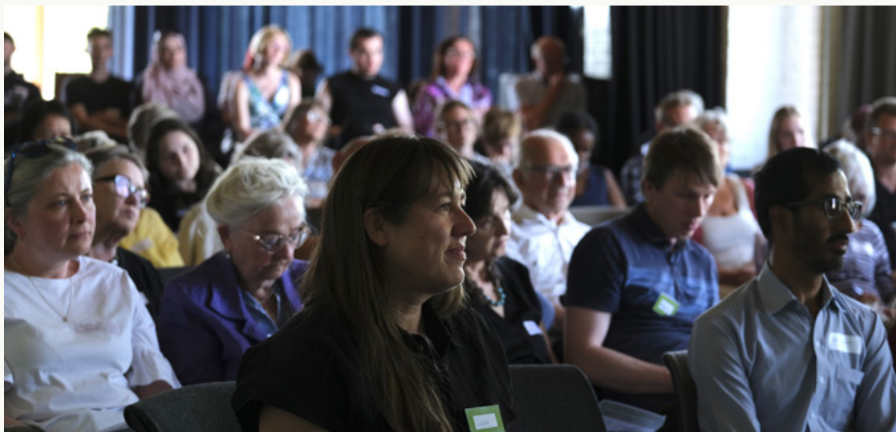
Mange hadde tatt turen til Nansenskolen en lørdag i juni for å delta på Nansenseminaret 2023.

Russlands angrepskrig mot Ukraina var bakteppet for flere av innleggene om dilemmaer i krig og fred under Nansenseminaret. I det offentlige ordskiftet etter den russiske invasjonen, opplevde mange et begrenset ytringsrom der det var liten plass til tvil.