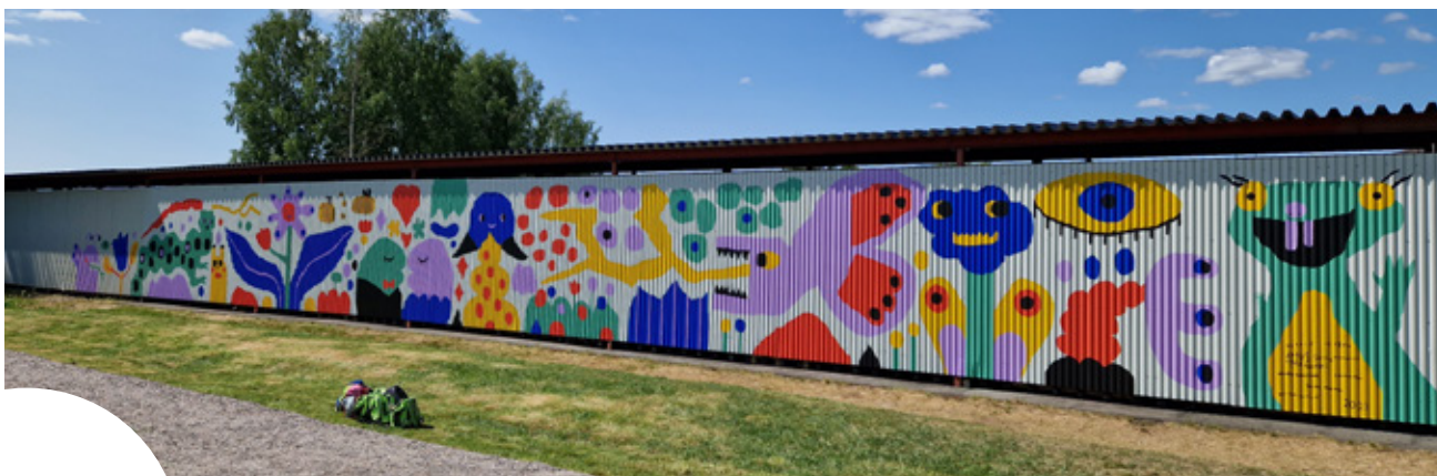
Kunstverket «Positiv monstervergg» en solrik sommerdag.