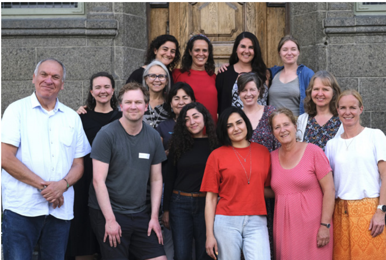
Norske og chilenske kollegaer samlet til obligatorisk gruppebilde på trappen foran 1918-bygget ved Nansen Fredssenter.